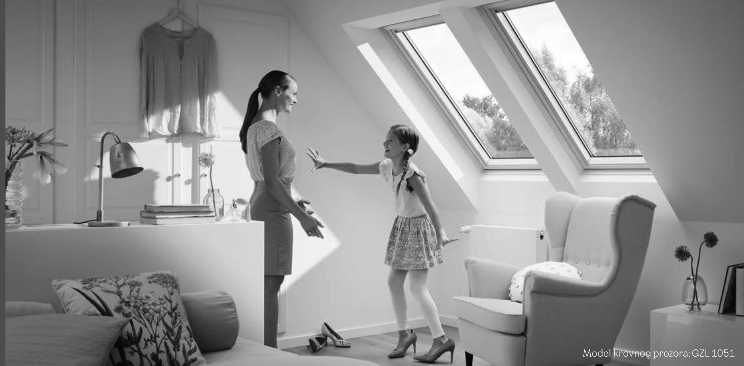
Model krovnog prozora: GZL 1051

Drveni krovni prozori s dvostrukim staklom i otvaranjem pomoću gornje ili donje ručke, po istoj cijeni.